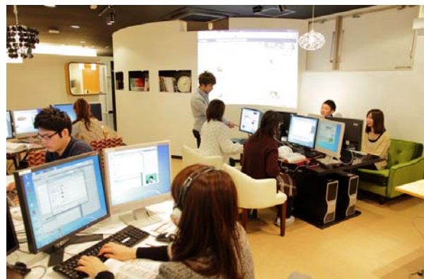
▲カフェ風なおしゃれな空間で自分のお気に入りのソファに座りながら好きな時間に自由に学ぶ(写真は渋谷校)

STUDIO 内は、クリエイティブなノマドワーカーの象徴でもあり、コワーキングスペースでも採用されている「お気に入りのカフェ」にいるような洗練された空間で、お仕事帰りや休日にも、快適な学習環境をお約束いたします。