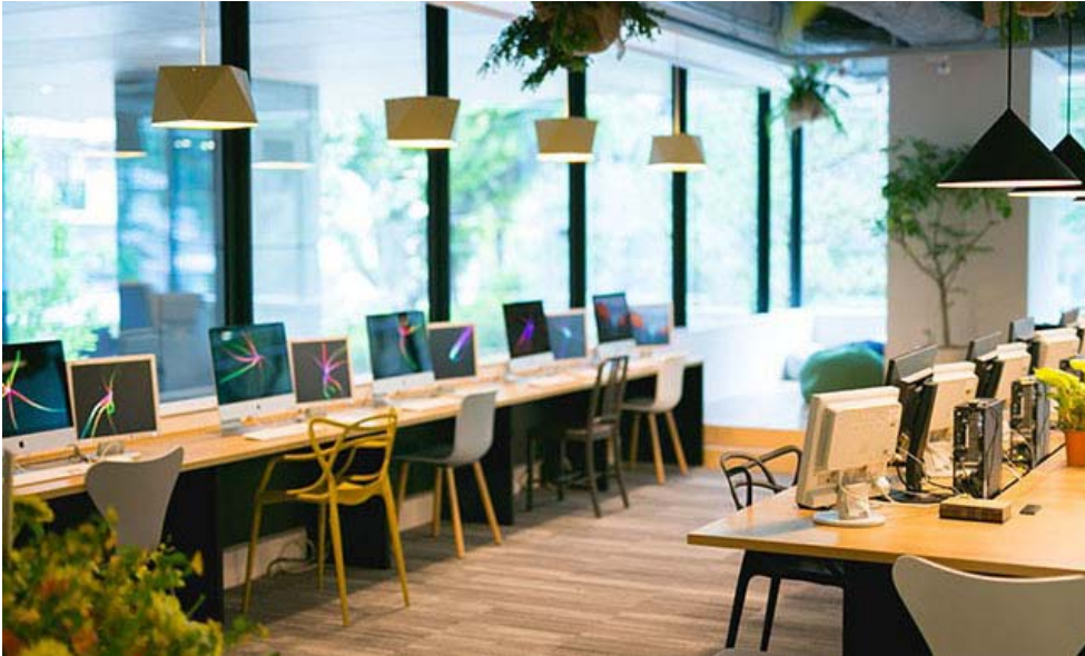
デジタルハリウッド STUDIO 渋谷