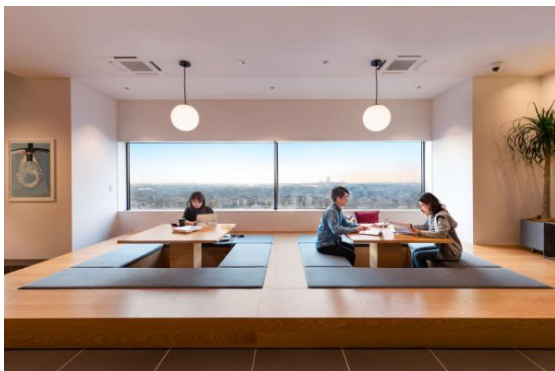
集中しやすいように工夫された空間デザイン