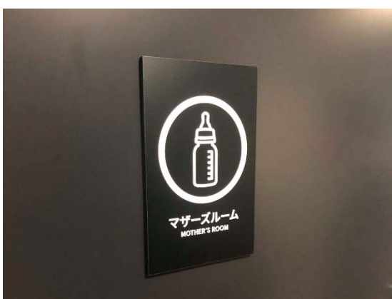
お子様連れ OK。授乳室も完備