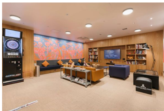
ゲームコーナーでいつでもリフレッシュ