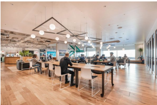
教室以外のコミュニティスペース