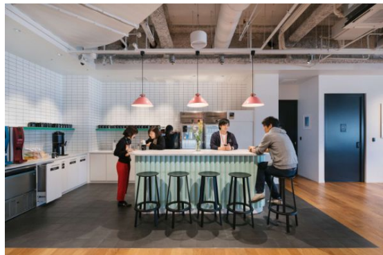
ラウンジスペースではドリンク飲み放題