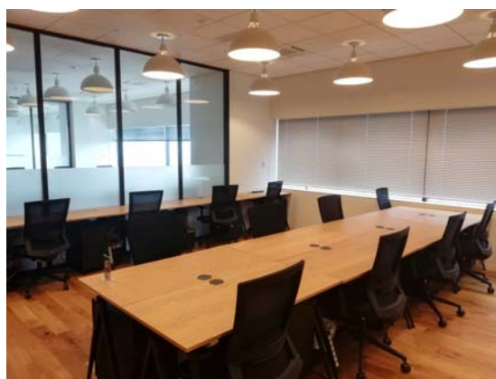
教室予定スペースは 28 階。ゆったり学べます。