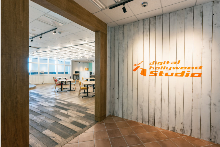
(デジタルハリウッド STUDIO 新宿)

デジタルハリウッド STUDIO 新宿へ入学を検討されている方には、説明会を随時開催しています。新しい環境で学びたい方、クリエイティブな環境に身を置き学習を進めたい方はぜひご参加ください。