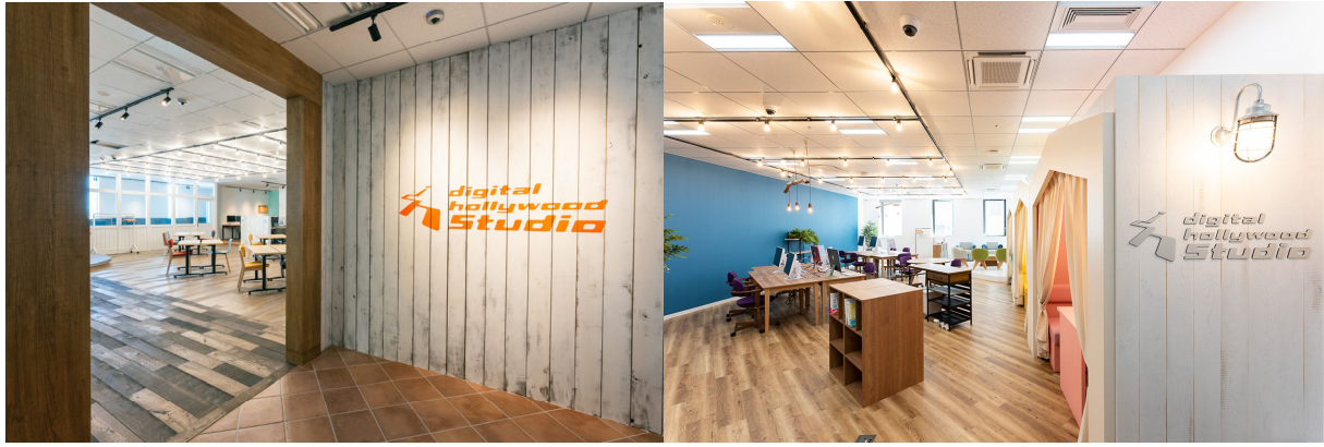
(写真左よりデジタルハリウッド STUDIO 新宿、三宮)