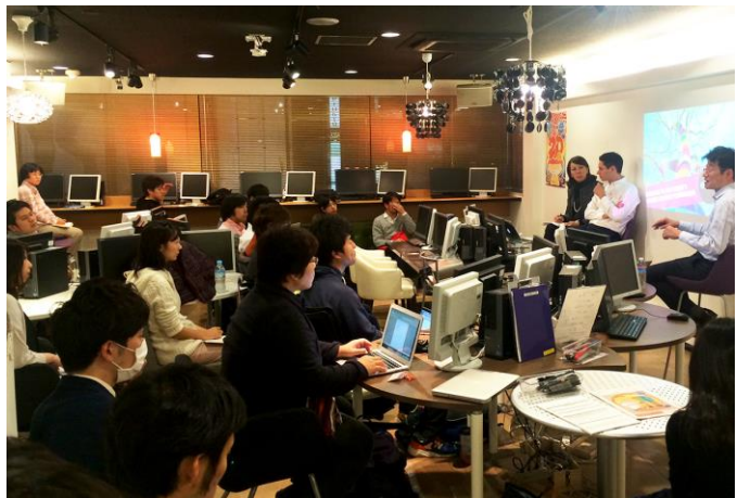
2014年11月のネット動画クリエイター開講記念セミナーの様様

最先端の制作スキルや現場でのワークフローなど、他では聞けない貴重な内容になりますので、ぜひご来場下さい。