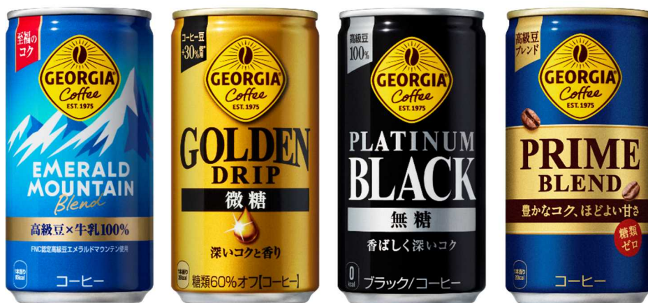
185g 軽量アルミ飲料缶採用「ジョージア」対象製品の一部

※2 「ジョージア」は、The Coca-Cola Companyの登録商標です。