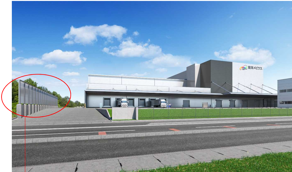
茶殻配合防音パネル使用

同社の持続可能な社会の実現への取り組みに賛同し、防音パネルの他、事務所壁面には茶殻入りデザインウォール「エコアートプラス」等の茶殻リサイクル品も採用しています。