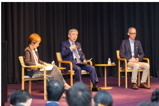
7、ダイアログセッション