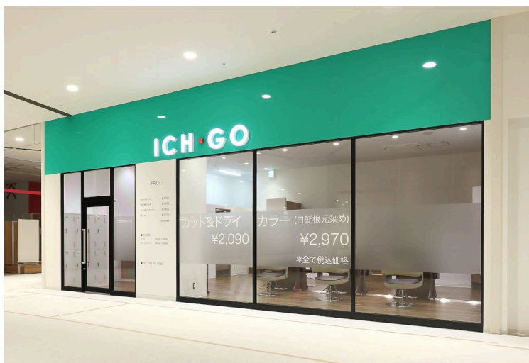
写真: ICH・GO 蕨錦町店

当社グループは、100年企業・100年ブランドを目指し、美容室業界のリーディングカンパニーとして、新しいビジネスモデルや高付加価値サロン経営を、人材力とテクノロジーを融合し創造していきます。