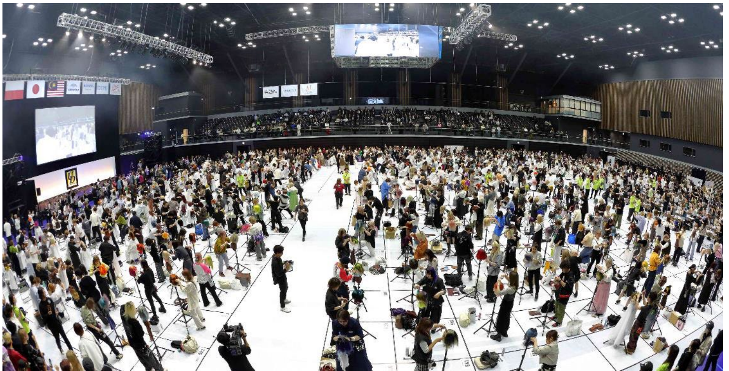
写真：「UNITED DANKS CONTEST 19」の様子