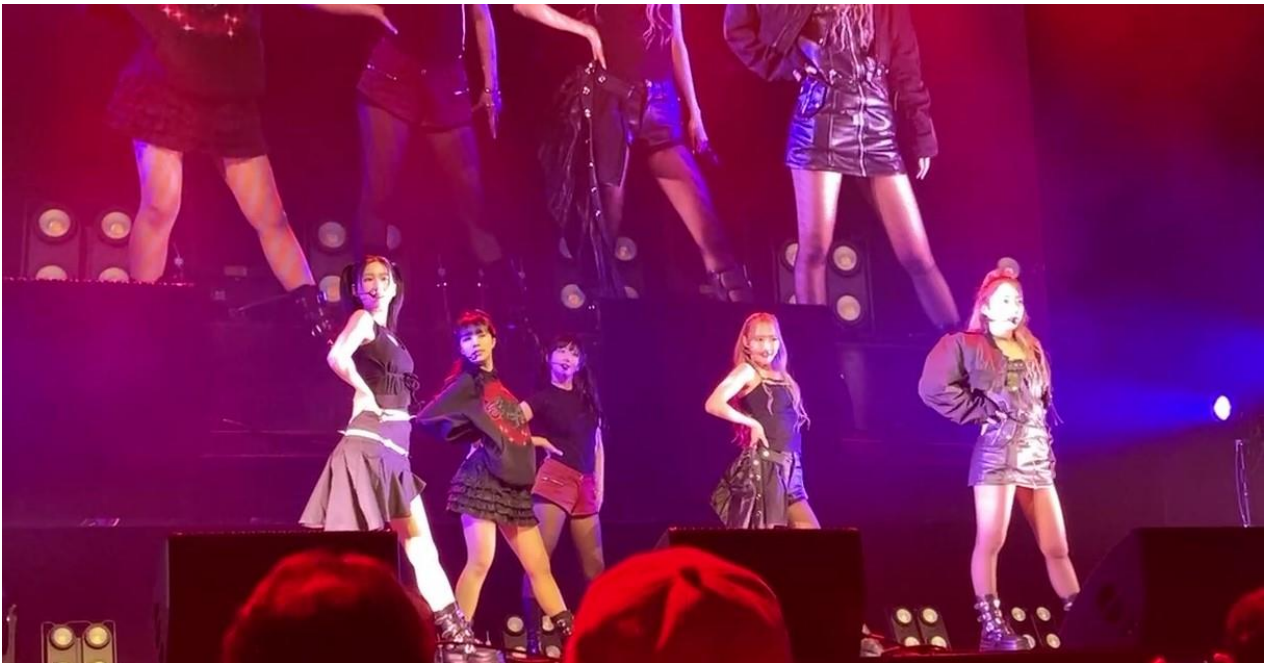
写真：「ViV」初来日ショーケースの様子

音楽レーベル・プロダクションEVA.ENTERTAINMENTに所属する、日韓合同7人組ガールズグループ「eite（エイト）」に続き、K-POPアイドルの初来日ショーケースのヘアメイクをAsh所属美容師が手掛けるのは2組目となります。約半年間、様々なライブイベントのバックヤードのサポートを通じて、アーティストの個性や表現を際立たせながらも、激しいパフォーマンスでも崩れにくいヘアメイクのノウハウやスキル向上につながっております。今後もアルテグループでは、スポンサー支援を通じて美容師の活躍の舞台を提供していきます。