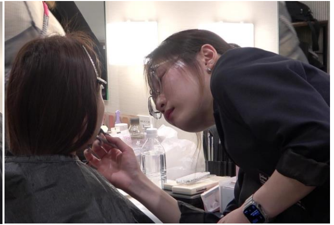
写真：「eite」 spring tour 2024 ステージとバックステージの様子