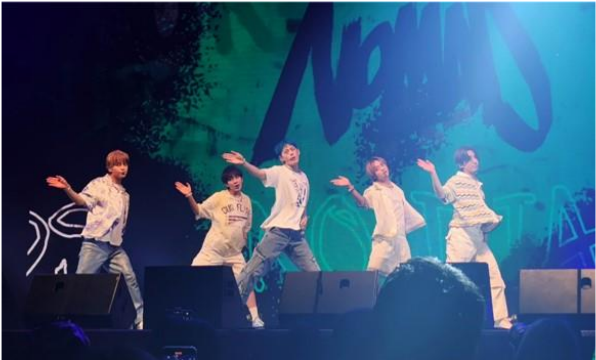
写真： NOMAD 2024 SHOWCASE IN JAPAN ステージの様子