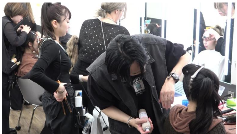
写真：「ViV」バックステージの様子