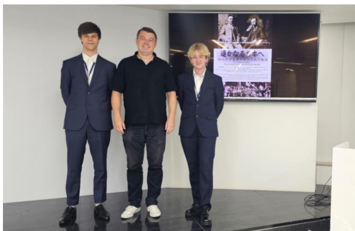
写真：ドキュメンタリー映画『遙かなる日本へ - 知られざるポーランド人の物語』のラドスワフ・ティシュキエヴィッチ監督と、社内上映会にて