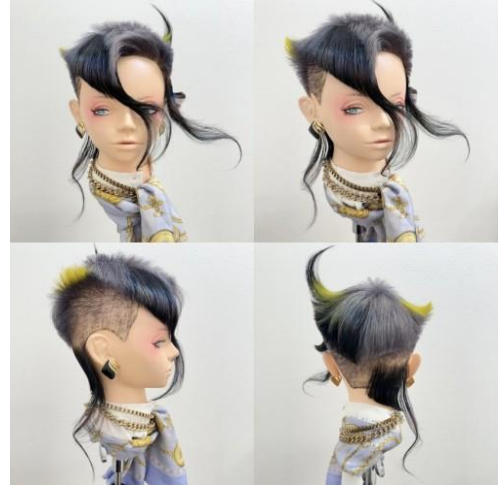
Ash 下北沢店 四ツ家 裕 渡辺 裕之 賞 銅 賞