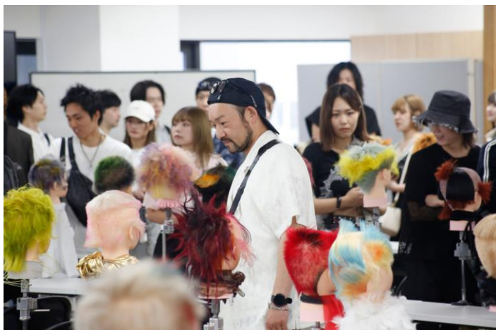
写真：スタッフ自由見学時間