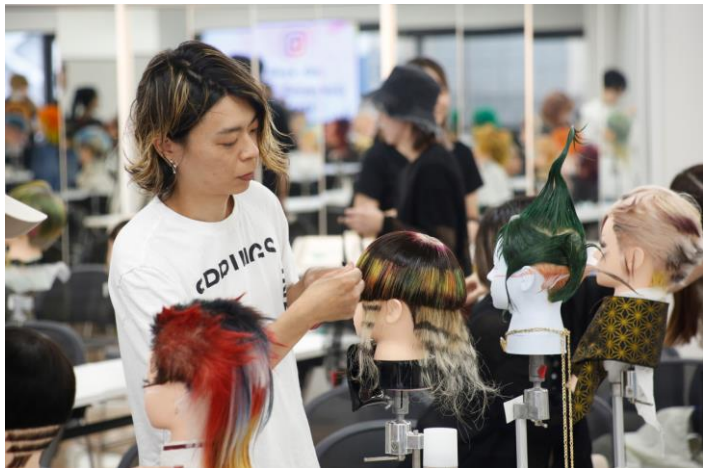
写真：ウィッグ準備