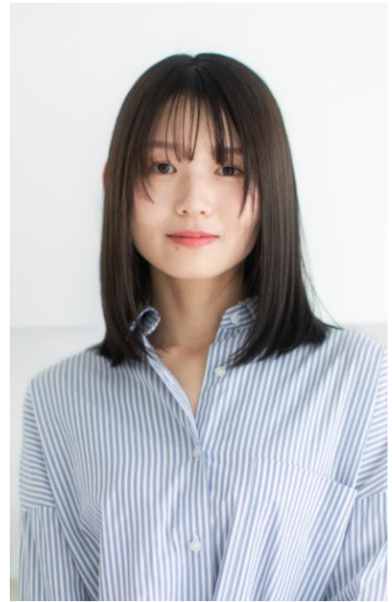
監修：Ash 中目黒店 高橋臣介