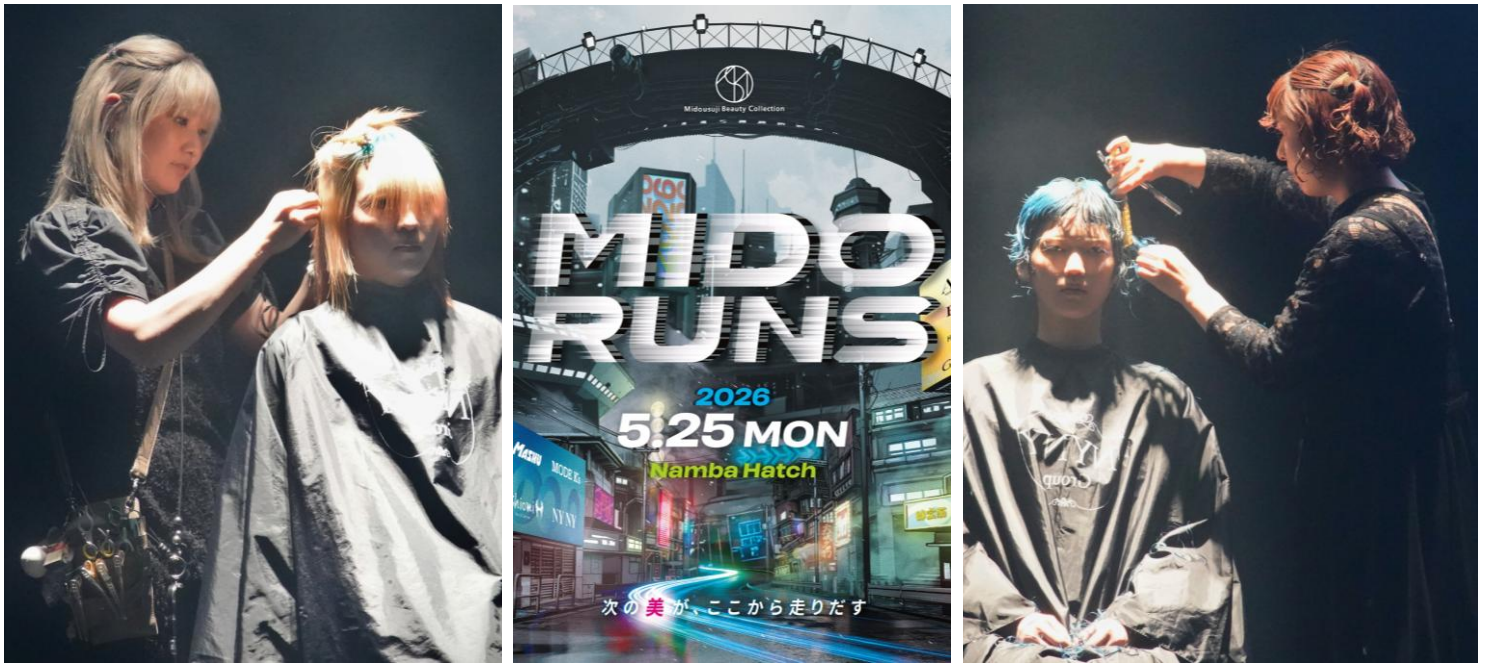
写真：『御堂筋ビューティーコレクション2025』の様子

当日は、NYNY所属美容師が出演するヘアショーステージに加え、一般来場者も無料で参加できるヘアアレンジブースを出展します。さらに会場では化粧品メーカー・美容家電メーカーの商品体験ブースも設置され、AIによるバーチャルMC、タレントやお笑い芸人などによる美容トークショー、和太鼓パフォーマンスなど、多彩なコンテンツが展開。美容業界関係者だけでなく、美容やファッション、エンターテインメントに関心のある一般来場者も楽しめる、“観て・触って・体験できる”新感覚のビューティーイベントです。