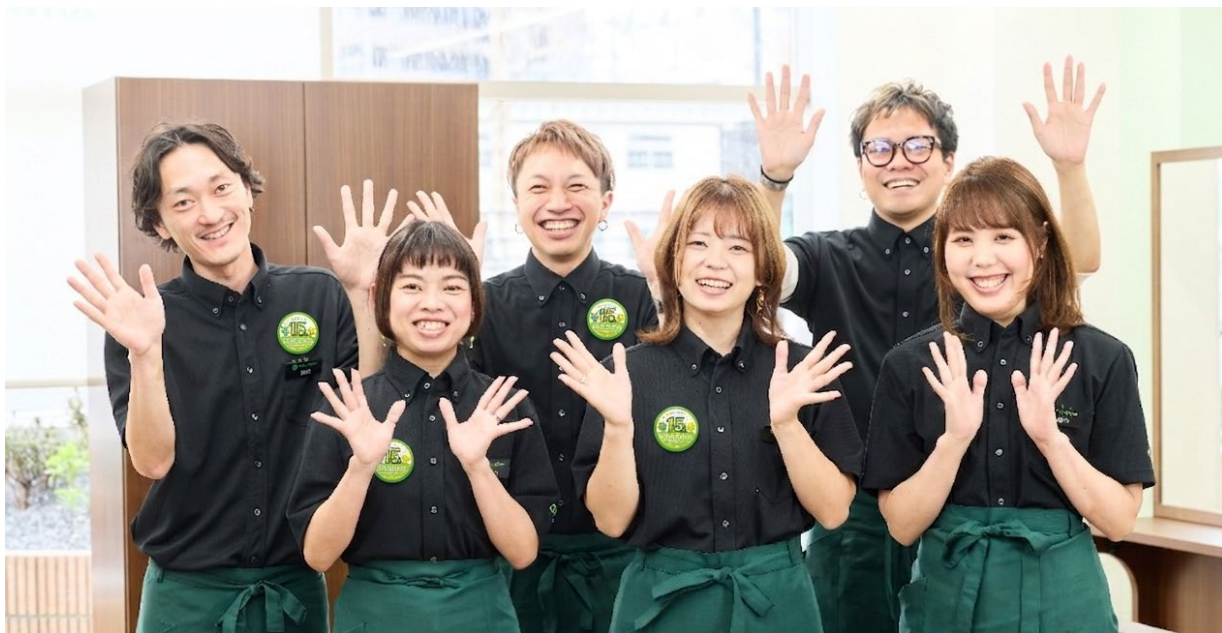
オリジナル缶バッジ着用イメージ