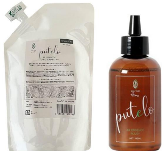
オリジナル商品販売中