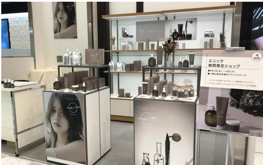
大丸芦屋店のポップアップストア（2021年9月開催）の様子

美容室チェーンを300店舗以上展開する株式会社アルテ サロン ホールディングス（神奈川県横浜市）は、ヘアケア&スキンケアブランド「ennic（以下、エニック）」のポップアップストアを大丸梅田店2階コスメイベントスペースにて2021年11月3日（水・祝）～11月9日（火）にオープンします。2021年9月に関西初出店を果たした大丸芦屋店での期間限定ポップアップストアが好評であったことから大阪の中心地、梅田への出店が決定しました。尚、2021年9月新発売のスタイリング剤「バーム セラム FH」が百貨店の店頭では今回初登場となります。