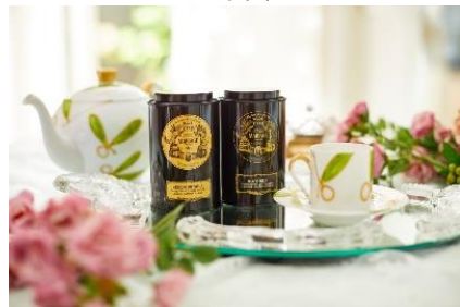
▲フランスの老舗紅茶ブランド「マリアージュフレール」