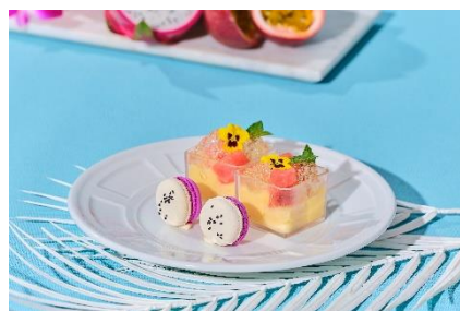
▲スイーツ(スタンド下段)