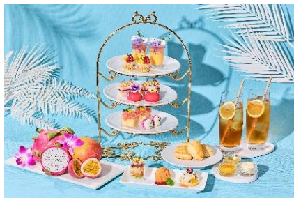
▲アフタヌーンティーイメージ