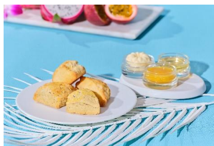
▲スコーン&コンディメント