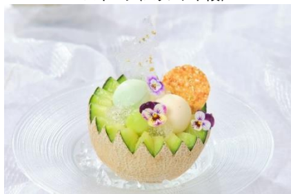
▲大人の贅沢メロンソーダ スパークリングワイン1本付(オプション)