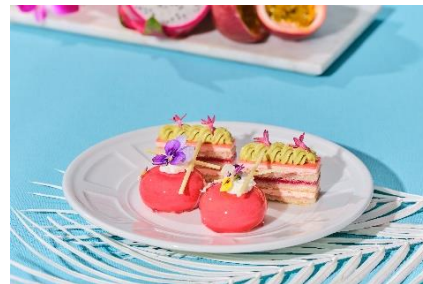
▲スイーツ(スタンド中段)