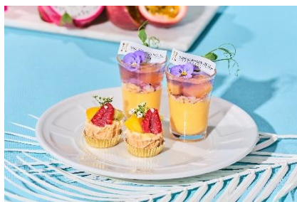
▲スイーツ(スタンド上段)