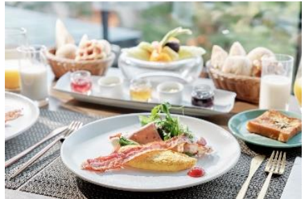
▲和洋食に加え、きしめんや名古屋コーチンの卵を使用したフレンチトーストなど、名古屋グルメも楽しめるbuffet朝食(シェフズライブキッチン)