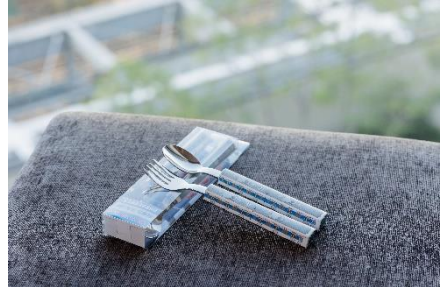
▲あおなみ線トレインケーキ(2車両編成)/トレインビュー客室からの眺望/あおなみ線スプーン&フォークセット