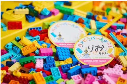
▲レゴランド®・ジャパン バースデーシール