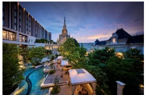
▲デラックスチャペルビューツインルーム/ホテル1階メインエントランス/ ホテル中庭「Cabana Garden」