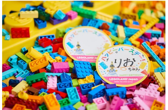
▲「あおなみ線」トレインケーキ(2両編成) /レゴランド®・ジャパン バースデーシール