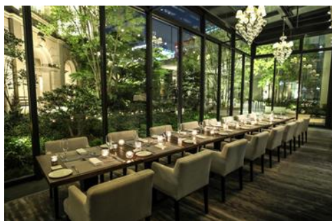
▲半個室(夜)イメージ