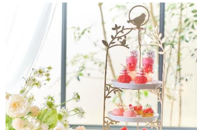
▲スイーツイメージ