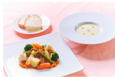
▲ランチA イメージ(オプション)