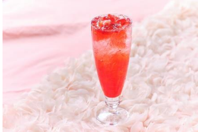
▲スペシャルドリンク いちご イメージ(オプション)