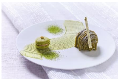
▲スペシャルティイメージ (オプション)