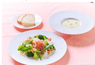
▲ランチBイメージ(オプション)