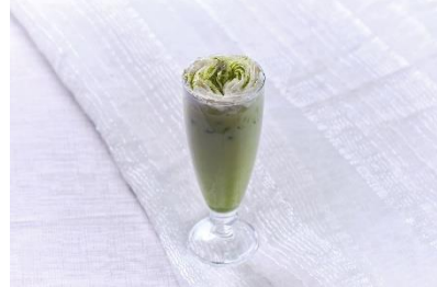
▲スペシャルドリンク 抹茶 イメージ (オプション)