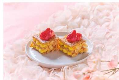
▲スイーツイメージ