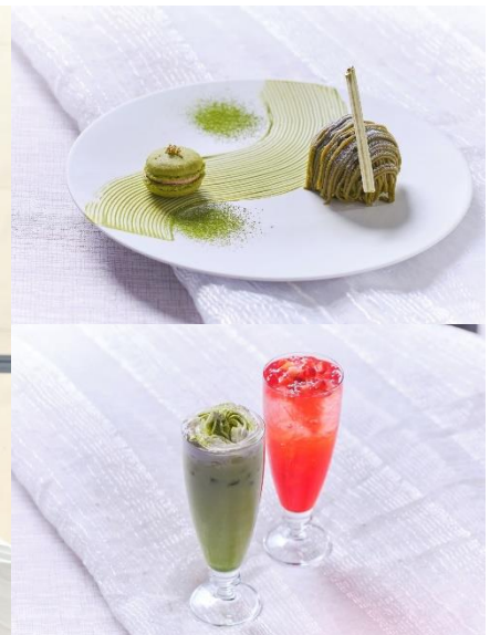
▲(左)アフタヌーンティー+スペシャルデザート+スペシャルドリンク ※上記5段スタンドは青山セントグレース大聖堂、String'sホテル 名古屋「ニューヨーククラウンジ」対象。会場により提供スタイルが異なります。(右上)スペシャルデザート (右下)スペシャルドリンク ※画像は全てイメージ