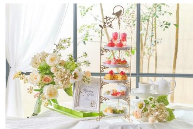
▲アフタヌーンティーイメージ(2名分)

※食材の仕入れ状況により、一部内容が変更となる可能性があります。 ※店舗によりメニューの内容が多少異なります。