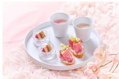
▲セイボリーイメージ