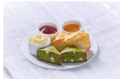
▲スコーンイメージ