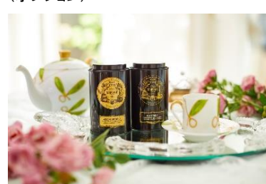
▲ティーセレクションプラン イメージ