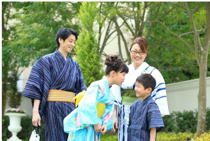
ファミリーでの記念写真にも(浴衣レンタルは大人用のみとなります)