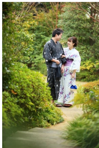
浴衣での庭園散策も可能