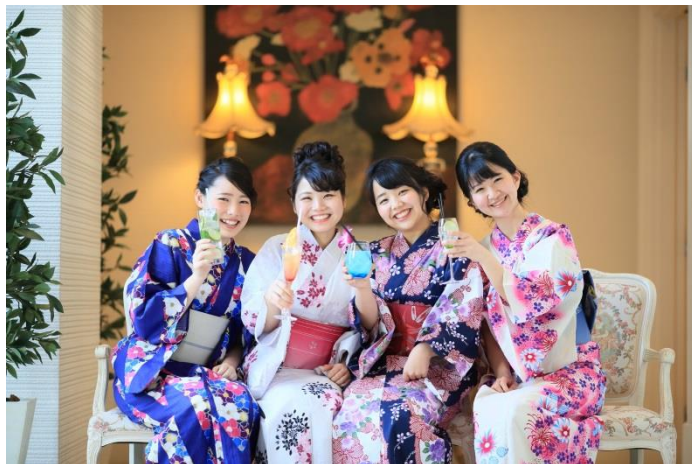
館内にもフオトスポットが満載