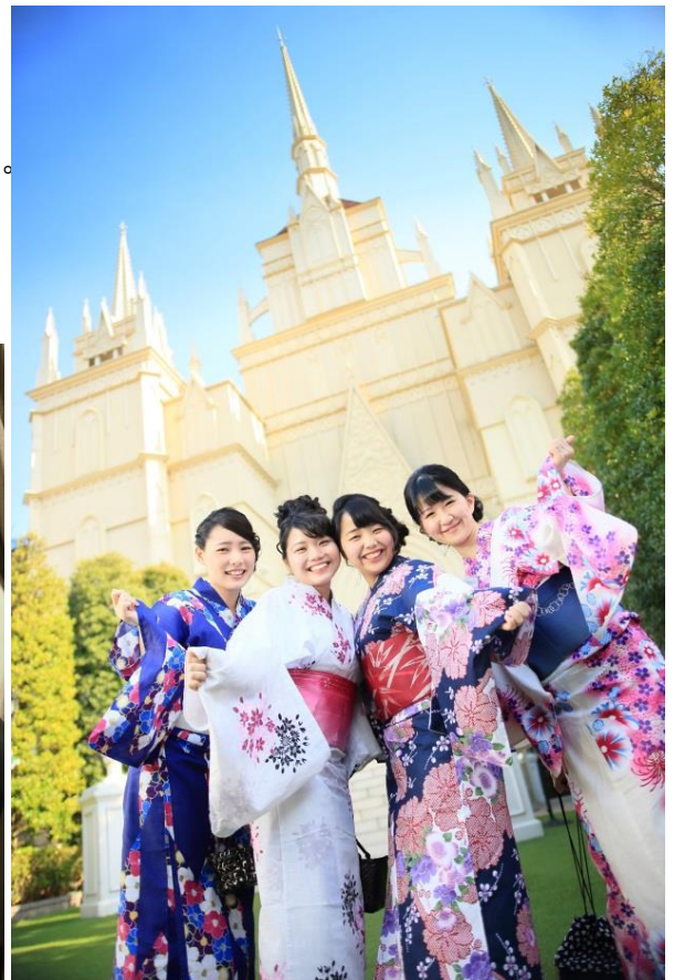
大聖堂前での撮影イメージ