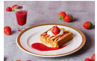
スペシャルティ イメージ