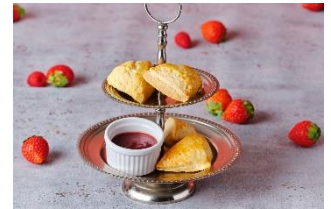
スコーンスタンド