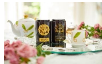
ティーセレクションイメージ