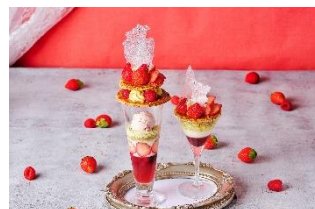
いちごのミルフィーユパフェ (左:通常サイズ・右:ミニサイズ)