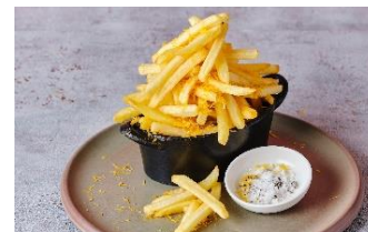
フライドポテト(オプション)