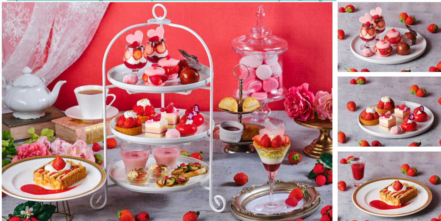
▲(左)真っ赤ないちごづくしのアフタヌーンティー※スペシャルティ・ミニパフェ付 (右上)アフタヌーンティー上段・中段スイーツ (右下)スペシャルティ ※写真はイメージ

https://www.bestbridal.co.jp/restaurant/special/detail-18344/?restaurant=iseyama_mangiare