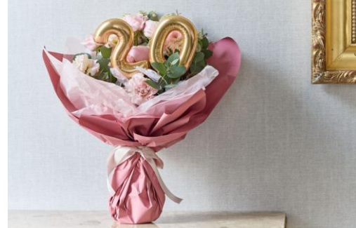
▲オプション③バルーン+花束