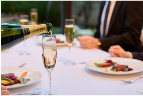
①ウェルカムドリンク