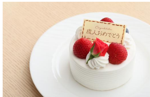
▲ストロベリーショートケーキ (ハート型やショコラケーキもございます。)