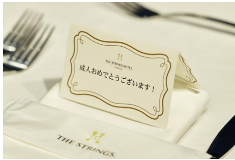
②「成人おめでとうございます」のアニバーサリーカード