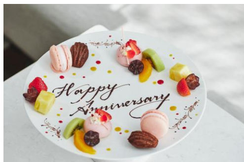
▲アニバーサリープレート