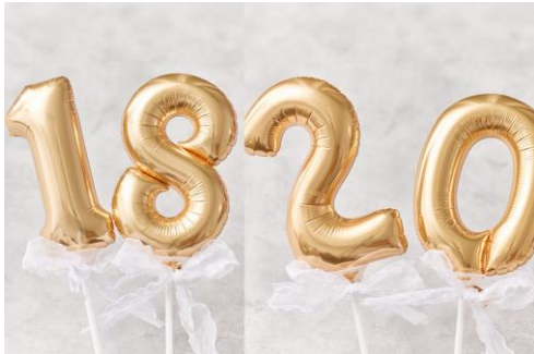
▲オプション①「18」または「20」バルーン