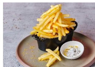
フライドポテト(オプション)