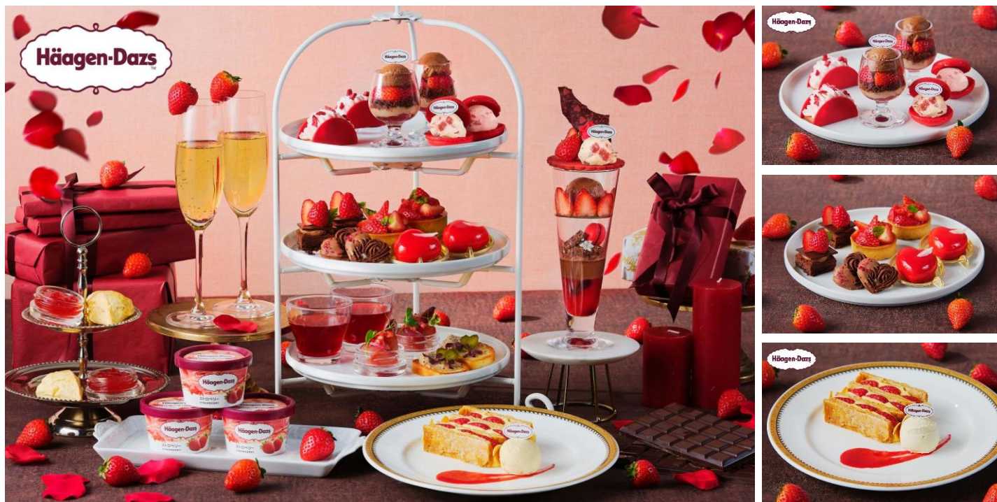
▲(左)いちごとチョコレートのアフタヌーンティーwithハーゲンダッツ※スペシャルティ・パフェ付 (右上)アフタヌーンティー上段・中段スイーツ (右下)スペシャルティ ※写真はイメージ

https://www.bestbridal.co.jp/restaurant/special/detail-18886/