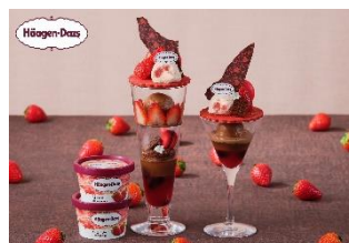
バレンタイン・ルージュパフェwith ハーゲンダッツ