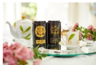
ティーセレクション