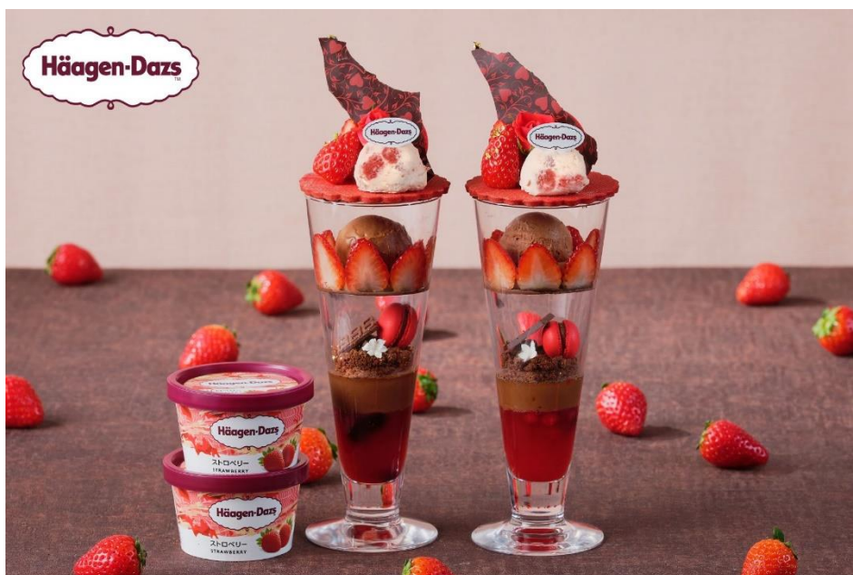
▲ バレンタイン・ルージュパフェ with ハーゲンダッツ イメージ

https://www.bestbridal.co.jp/restaurant/special/detail-19004/