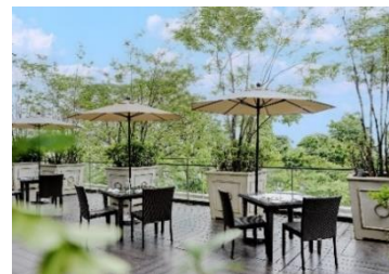
璃宮庭園を臨むガーデンビューテラス