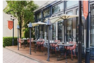
愛犬同伴も可能なマンジャーレテラス