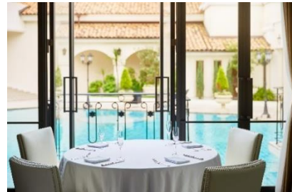
プールサイドの窓際席