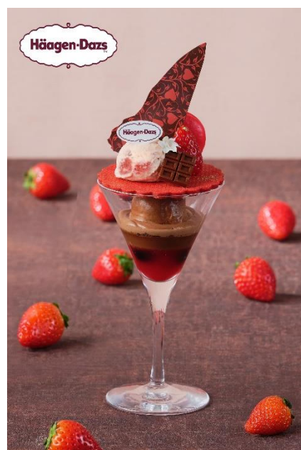
▲ ミニパフェ イメージ

2026年のバレンタインシーズンはハーゲンダッツ アイスクリーム「ストロベリー」と「ミルクチョコレート」の2種のアイスクリームを主役に、旬のいちごと多彩な素材を贅沢に重ねた至高のパフェを期間限定で販売いたします。