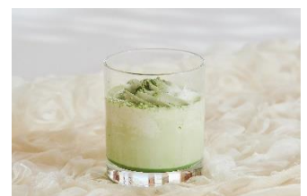
抹茶ドリンクホット(オプション)