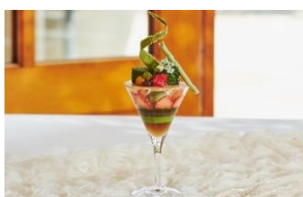
ミニパフェ(オプション)