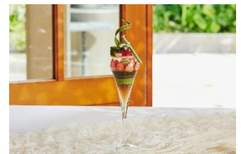
パフェ(オプション)横浜・大宮店舗のみ