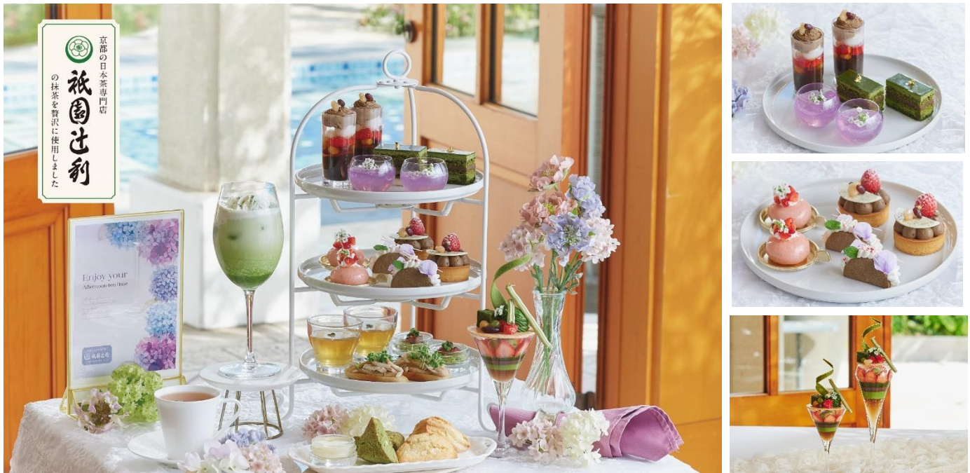
▲(左)抹茶と紫陽花のアフタヌーンティ with 祇園辻利※スペシャルドリンク・パフェ付 (右上)アフタヌーンティー上段・中段スイーツ (右下)宇治抹茶といちごのパフェ with 祇園辻利

シーズンごとに変わるテーマで、専属パティシエが手掛ける繊細で華やかなスイーツが人気のアフタヌーンティー。