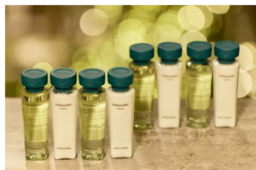
▲「サルヴァトーレフェラガモ」のバスアメニティ