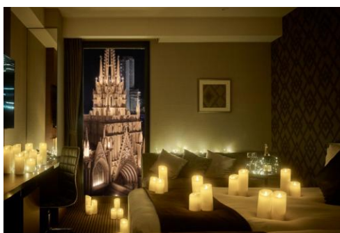
▲キャンドルデコレーション