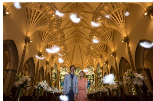
▲フェザーシャワー演出