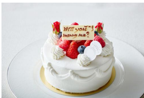
▲プロポーズケーキ