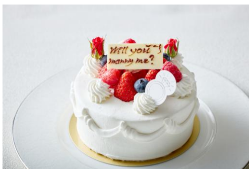
▲プロポーズケーキ