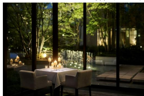
▲グラマシースイート店内