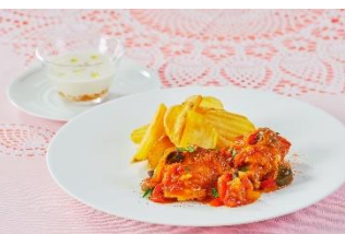
チキンランチ(オプション)