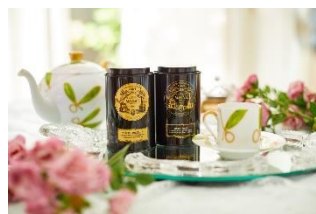
マリアージュフレール