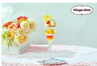
パフェ(オプション)横浜・大宮店舗のみ