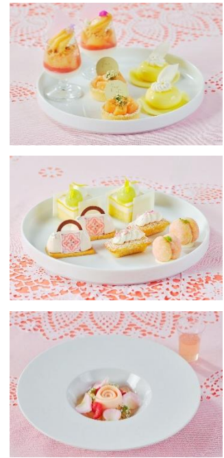
▲(左) Peach Vacances Afternoon tea オプションドリンク・ミニパフェ付 (右上)アフタヌーンティー上段・中段スイーツ (右下)赤桃とライチ、バラ香るセミフレッド(オプション)