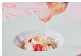
赤桃とライチ パラ香るセミフレッド(オプション)