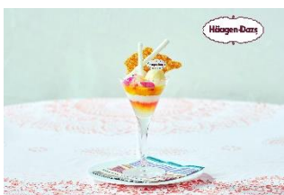
ミニパフェ(オプション)