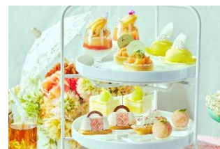
アフタヌーンティー スイーツ