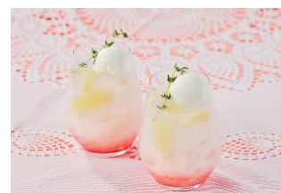
ピーチフロート (オプション)