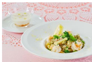
パスタランチ(オプション)