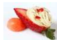
イチゴの一口パスタ