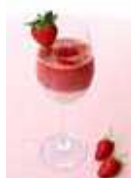
ストロベリー ミルク カクテル