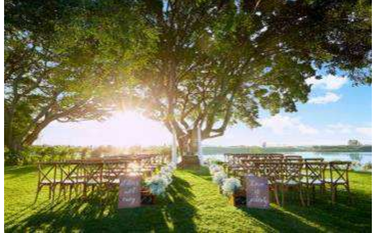
▲画像はイメージです