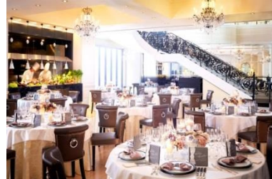
▲(上)青山セントグレース大聖堂外観 (下)buffet会場「グラマシー・スイート」