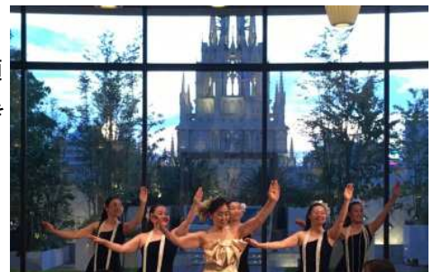
▲昨年も大好評のフラダンスショー