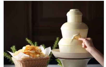
▲チョコファウンテンイメージ