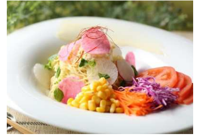
▲北海道発祥のラーメンサラダ