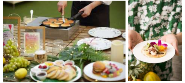
▲パンケーキは、お客様自身でトッピングして楽しめる内容