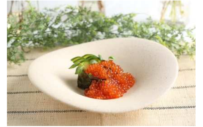
▶ 溢れる程のいくらが乗った軍艦巻きは、1,000円で注文可