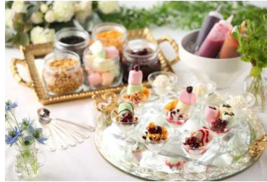
▲北海道ミルクのソフトクリーム