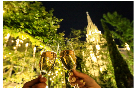
▲大聖堂を臨むガーデンで乾杯!