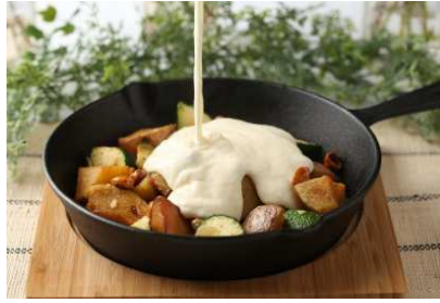
▲あつあつの北海道チーズをかけて