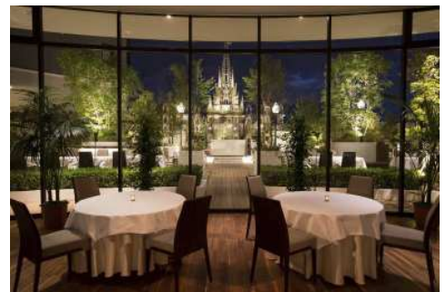
▲大聖堂を眺めながら楽しむメイン会場

https://reservation.yahoo.co.jp/restaurant/detail/s000207855/