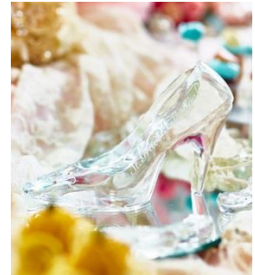
▲ガラスの靴イメージ