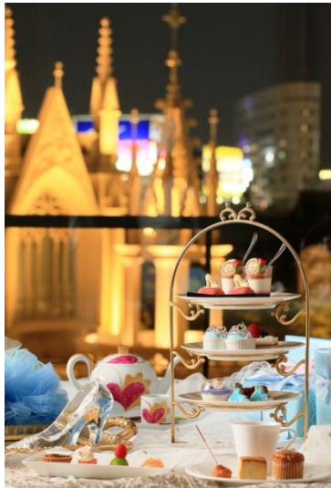
▲ライトアップされた大聖堂が幻想的

日中の明るい店内とは雰囲気を変え、夜はライトアップされた大聖堂がロマンチックなニューヨーククラウンジ。18:00以降来店のお客様限定で、ノンアルコールシンデレラカクテルをご提供いたします。幻想的な景色を眺めながら、一味違ったプリンセス・シンデレラのアフタヌーンティーをお楽しみください。