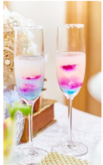
▲シンデレラカクテルイメージ