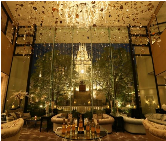
▲夜はロマンチックな空間に変わるニューヨーククラウンジ