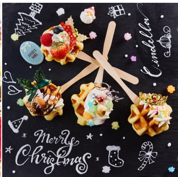
▲「デザートbuffet」イメージ。童話「シンデレラ」に登場するモチーフのスイーツが、クリスマス限定バージョンとなって登場。