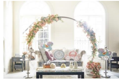
フォトスポットイメージ

https://www.bestbridal.co.jp/restaurant/event_base/cinderellaxmas_aoyama/