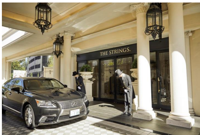
▲ホテル入り口・車寄せ

ホテルリブランドに伴い、施設内のロビー・エントランス・レストラン・宴会場(披露宴会場)・客室を改装し、装いも新たに、今後はStrings傘下の下、「サー ウィンストンホテル 名古屋 by Strings」としてなお一層お客様の心に残り続ける最高のおもてなしと、感動を体験できる空間を提供してまいります。