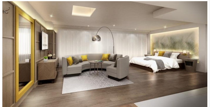
▲ANNIVERSARY SUITE イメージ