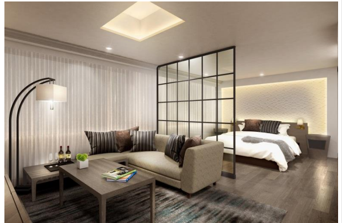
▲CLASSIC SUITE イメージ