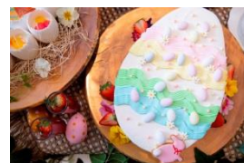
▲デザート&軽食buffetイメージ

キリスト教において最大のお祭りといわれ、日本でも年々その認知度が高まっている「イースター」(復活祭)をテーマとしたデザート&軽食buffetと、プロのパティシエがカップケーキ作りを教えるキッズパティシエ体験イベントを2日間限定で開催いたします。