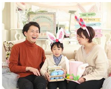
▲フotスポットイメージ