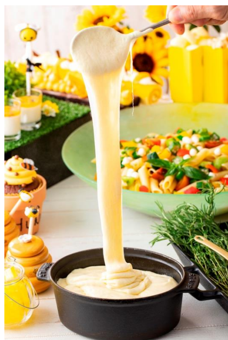
写真はすべてイメージ

会場となる「新浦安アートグレイス ウェディングコースト」は、美しい眺めと潮風が心地よい、4,300坪もの広大な敷地に建てられたゲストハウスウェディング会場。普段は結婚式でしか足を踏み入れることのない特別な空間を一般開放して開催される、「ハニーハント デザートbuffet」をご堪能ください。