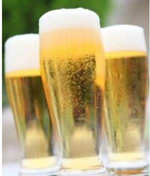
▲写真左上より時計回りに：フオトスポットイメージ、グリルワゴンイメージ、ビールイメージ、グリルワゴンで仕上げたお肉料理イメージ、ハートづくしのデザート盛り合わせイメージ(プランによって1～3種チョイス)