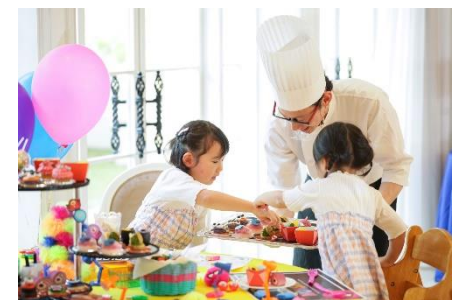
▲スイーツのおかわりはシェフやサービススタッフが持ち回り提供