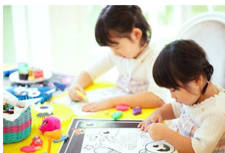
▲テーブルには“塗り絵”や“おもちゃ”が置いてあるのでお子様も飽きずにお楽しみいただけます