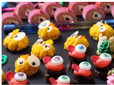
▲安納芋と栗のモンブラン“ほっくりん” 国産黄栗の甘露煮を生クリームで包み、その上から甘さが日本一のさつまいもと言われる安納芋のクリームを絞ったモンブラン