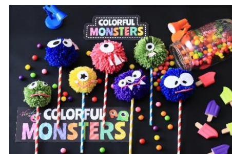
▲かわいいフォトスポット・フォトアイテムが充実 会場内には、フォトスポットを設置しており、様々なフォトアイテムを使って記念写真が撮影できる