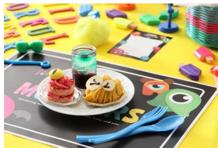
▲モンスターデザインのランチョンマットが可愛い