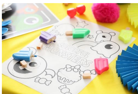
▲モンスターデザインの塗り絵 イメージ