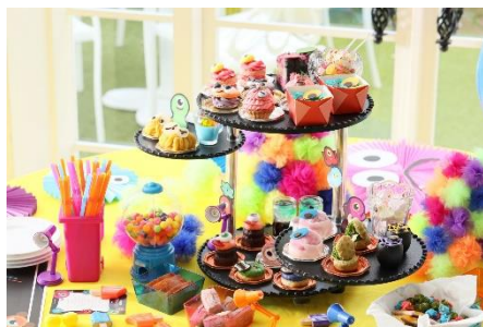
▲自分だけのテーブル上にスイーツが勢ぞろい