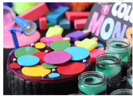
▲カラフルカシスムース さっぱりとしたカシスの味が引き立つように、ムースの中には、ミルクチョコレートのガナッシュが入っている