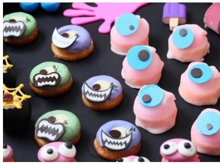
▲フランボワーズのムースを求肥で包んだケーキや、チョコレートのコーディングをしたドーナツなど、表情豊かなモンスタースイーツが勢ぞろい