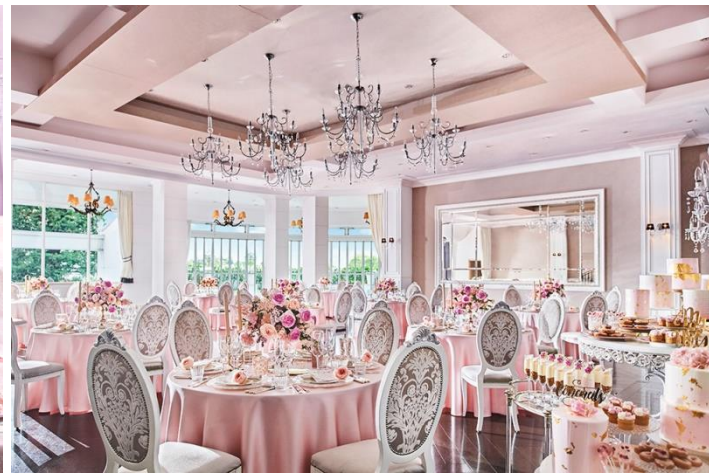
食事会場イメージ

時代を超え、数々の映画やドラマなどで描かれてきたフランス王妃“マリー・アントワネット”をイメージした3日間限定のスイーツイベント『マリー・アントワネットのストロベリー宮殿～sweets jewelry～』。いちごやチョコレートのほか、紅茶や薔薇などヨーロッパを感じさせる素材も取り入れた宝石のように美しいスイーツと、サラダやパスタなどの軽食も含めた約20種類をお召し上がりいただけます。