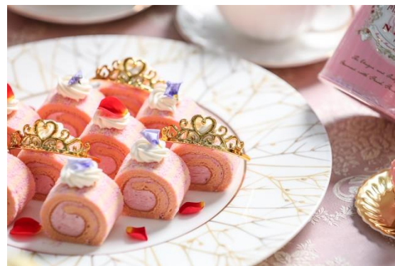
スイーツイメージ

さらに、“王妃の部屋”をイメージしたフォトスポットも登場。ご友人同士でも、お子様連れのご家族でも、思い出に残る素敵な写真を残していただけます。