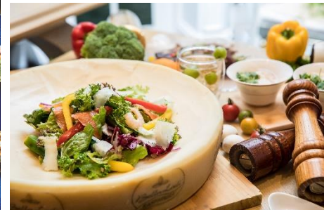
【写真左より時計回り】ビアガーデンイメージ、ドリンクイメージ、シェフが目の前でスライスするラスパドゥーラチーズ

『“ギルトフリー”夏を愉しむヘルシービアガーデン』では、低カロリー・高タンパクの食材を使用し、コース仕立てで仕上げた彩り豊かな夏らしいスパイシー料理と、ビールやカクテルなどのフリーフローをご堪能いただけます。