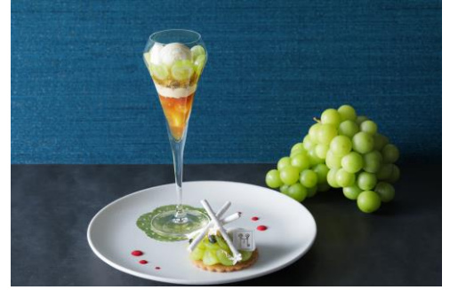
▲パフェ上段／パフェ下段 イメージ