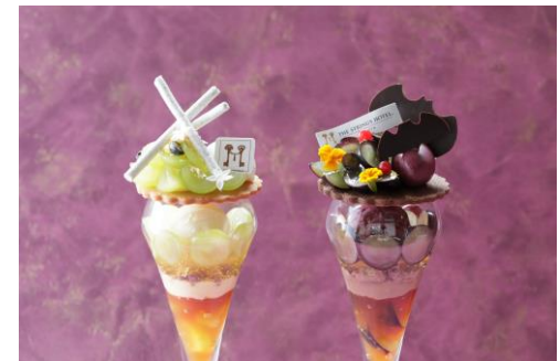
▲パフェ上段／パフェ下段 イメージ