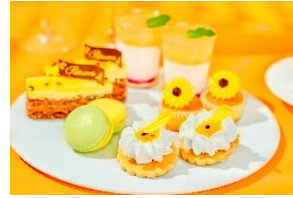
スタンド1段目(スイーツ)