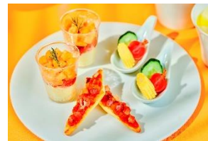
スタンド3段目(セイボリー)