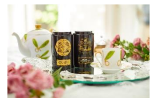
ティーセレクションイメージ