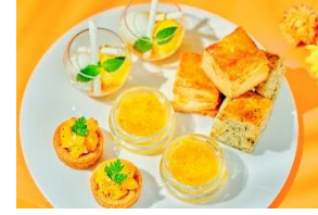
スタンド2段目(スイーツ)