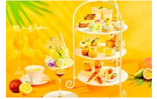
パフェとのセットも販売