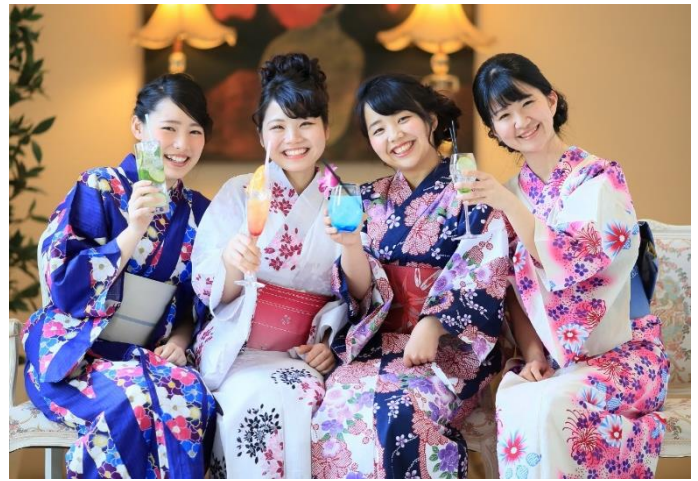
『トロピカル・サマー・アフタヌーンティー～HIMAWARI～』(2名分)イメージ