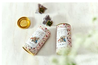
▲ピーターラビット™ オリジナルギフトブレンドティー イメージ