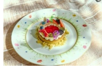
▲スペシャルティイメージ