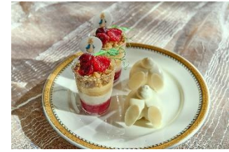
▲スタンド上段イメージ