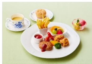
▲お子様プレートイメージ ※お子様メニューはピーターラビットコラボレーションメニューではございません。