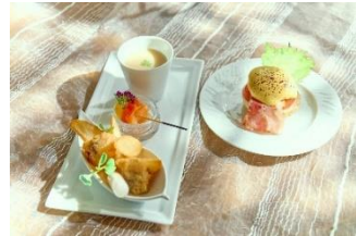
▲セイボリーイメージ