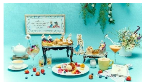
▲『ピーターラビット™ アフタヌーンティー～in Flower Garden～』イメージ

HP： https://www.strings-group.jp/omotesando/restaurant/zelkova/info/zelkova-aft_pt.html