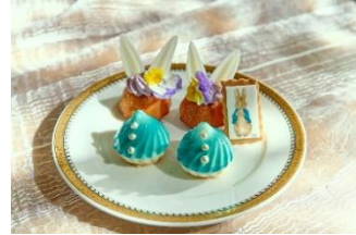
▲スタンド下段イメージ