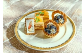
▲スタンド中段イメージ