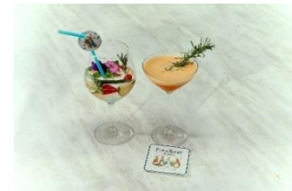
▲スペシャルドリンクイメージ