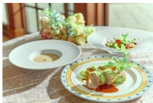
▲ランチコースイメージ