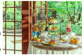
▲アフタヌーンティーイメージ

ピーターラビット™ オリジナルギフトブレンドティー 2,000円 *ルピシアとの共同開発により作成 https://www.lupicia.com/