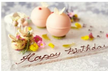
▲お誕生日のお祝いメッセージを入れることもできます