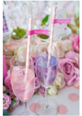
▲水色からピンクへと色が変わる、まるで魔法のようなウェルカムドリンク