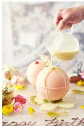
▲ホワイトチョコをかけて溶かすと、中からお花畑をイメージしたムースが登場