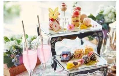
▲2段のティースタンド