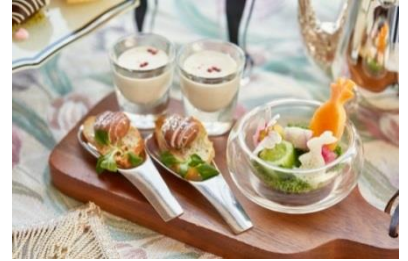
▲「うさぎ」や「にんじん」、「ハート」をかたどり、見た目にもこだわったセイボリー