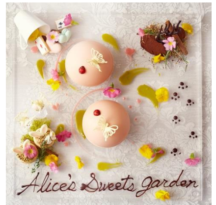
▲パティシエがテーブルにアートを描く、芸術的なデザート