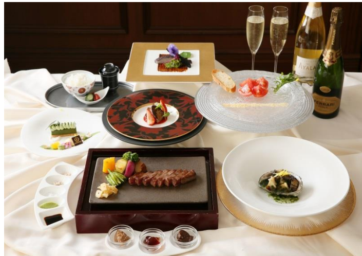
▲コース料理イメージ