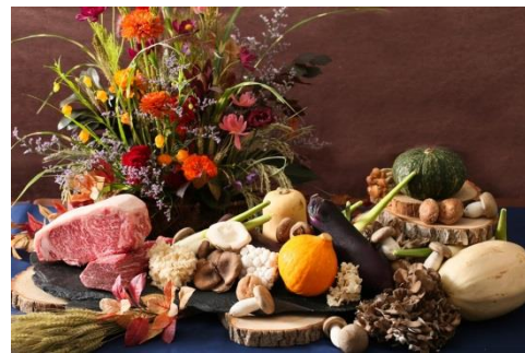
▲料理長が厳選した旬の食材が揃う