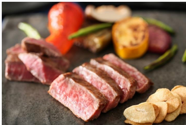
▲愛知県奥三河特産「鳳来牛」