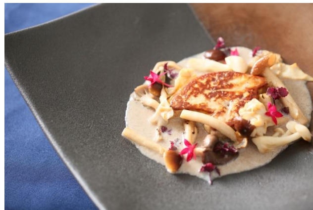
▲フォアグラのグリルは旬の茸をふんだんに使った一品