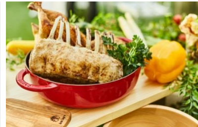
メイン料理イメージ