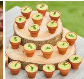
宇治抹茶のティラミス